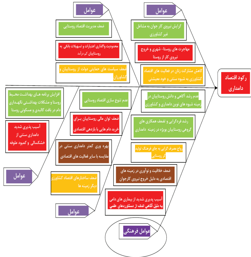
شکل ۱. مدل علت‌شناسی رکورد اقتصاد دامداری در روستاهای مورد مطالعه

سپس به منظور آگاهی از دیدگاه‌های جامعه آماری در زمینه نتایج به دست آمده از فرایند نمودار علت و معلول، پرسشنامه تحقیق بر پایه تعداد علت‌های شناسایی شده در جلسه "طوفان ذهنی" (۱۷ علت) طراحی و اجرا گردید (جدول‌های ۳ و ۴).