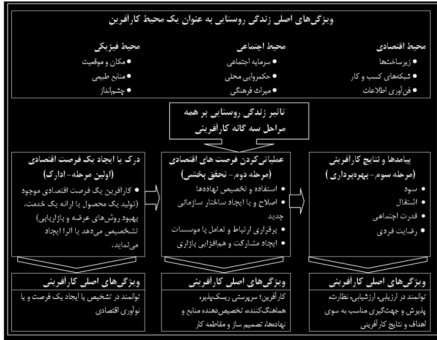
شکل ۱. فرآیندهای کارآفرینی روستایی