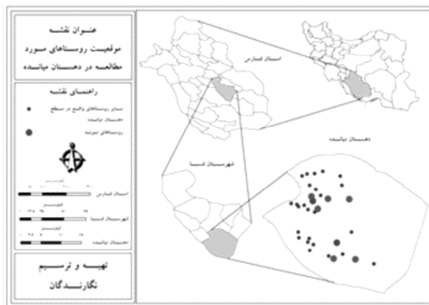
شکل ۱. نقشه موقعیت فضایی روستای مورد مطالعه در سطح دهستان میانده