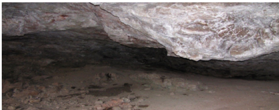
فصلنامه پژوهش‌های روستایی

تصویر ۲. نمایی از منظر روستای کزج.