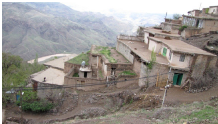
فصلنامه پژوهش‌های روستایی

انسان غارنشین همواره در تیررس مرگ و نابودی و توالی‌های طبیعت و نیازمند فضایی بود که بتواند در امتداد طبیعت به زندگی بپردازد. او در جست‌وجوی فضای بسته‌ای بود که خود را در داخل آن پناه دهد و در امان باشد (Homayun, 1974). شکل‌گیری تجربه مستمری از زندگی موجب حفظ او از دست مرگ شده و او را زنده نگه می‌دارد و راز این جاودانگی، پنهان شدن انسان‌های