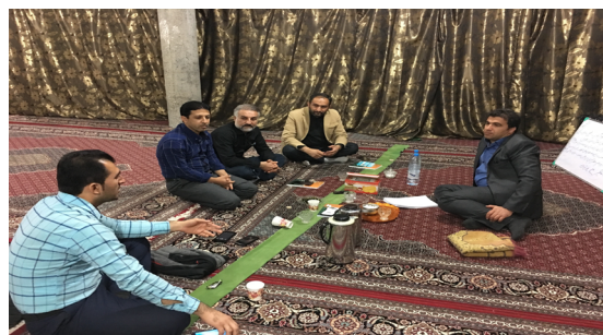
تصویر ۲. کارگاه مشارکتی مسئولان اجرایی.