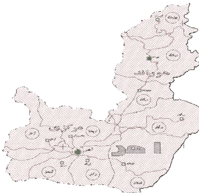
شکل ۲. نقشه تقسیمات شهرستان اهر