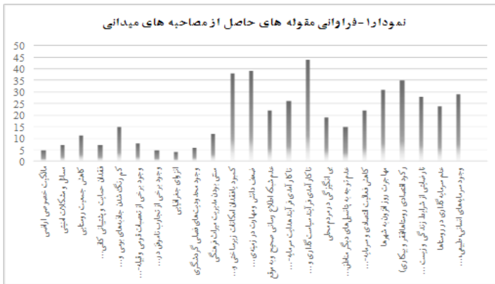
فصلنامه پژوهش‌های روستایی